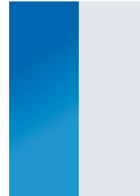
1/2 im Anschnitt 107 x 297 mm 490 €*