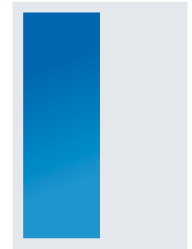
1/2 Satzspiegel 90 x 274 mm 490 €