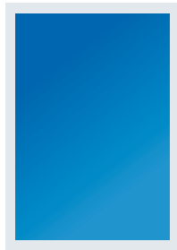
1/1 Satzspiegel 185 x 274 mm 920 €