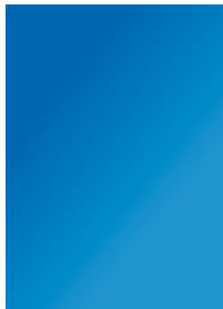
1/1 im Anschnitt 210 x 297 mm 920 €*